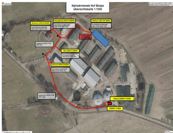
Übersicht des Nahwärmenetzes