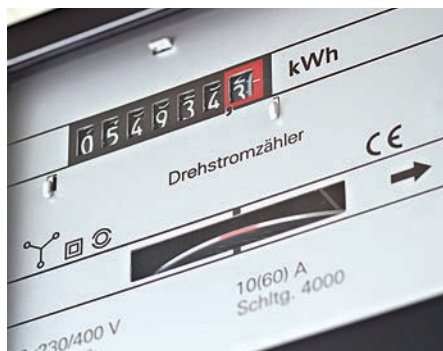
Beim Energieaudit werden alle Energieflüsse systematisch erfasst und analysiert.

Nach dem Energiedienstleistungsgesetz (EDL-G) besteht für Unternehmen, die gemäß EU-Definition kein kleines oder mittleres Unternehmen (KMU) sind, die Verpflichtung, bis zum 5. Dezember 2015 ein Energieaudit durchzuführen. Das betrifft auch öffentliche Unternehmen und Einrichtungen. Die Landgesellschaft verfügt über das Know-how sowie registrierte Auditoren zur Durchführung des Energieaudits. Darüber hinaus werden auch die Einführung eines Energiemanagementsystems nach DIN EN ISO 14001/ 50001 sowie Leistungen der