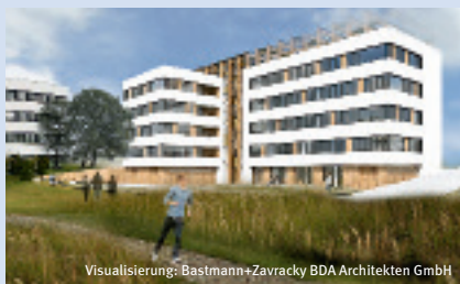
Visualisierung: Bastmann+Zavacky BDA Architekten GmbH

In Rostock wird das »Internationale Haus des Tourismus« entstehen. Es wird mehrere Institutionen unter einem Dach vereinigen, darunter den Tourismusverband M-V. Das Bauprojekt wird von der EGS