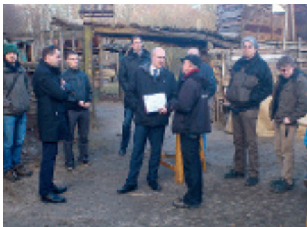
Der Energieminister des Landes, Christian Pegel, übergibt den Fördermittelbescheid an den Verein.

Die Kinder und Betreiber des Bauspielplatzes Schwerin e.V. hatten Ende Februar prominenten Besuch und Anlass zur Freude: Christian Pegel, neuer Energieminister des Landes M-V, übergab dem Verein einen Förderbescheid über fast 17.000 Euro aus dem »Aktionsplan Klimaschutz«. Die bewilligten Mittel sollen zur energetischen Erneuerung der Heizungsanlage für die Gebäude auf dem Bauspielplatzgelände eingesetzt werden. Bei einer Gesamtinvestition in Höhe von ca. 34.000 Euro bringt der Verein die Hälfte als Eigenanteil auf.