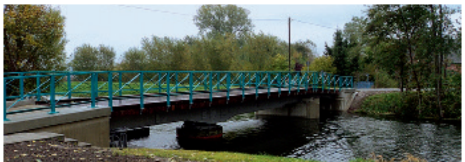
Die Brücke über den Bützow-Güstrow-Kanal bei Zepelin wurde im Rahmen eines Flurbereinigerungsverfahrens erneuert.