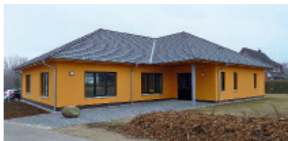
Der Kalksandstein-Winkelbau mit Walmdach fügt sich harmonisch in die dörfliche Gemeinde ein.