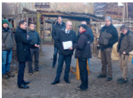
Der Energieminister des Landes, Christian Pegel, übergibt den Fördermittelbescheid an den Verein.

Die Kinder und Betreiber des Bauspielplatzes Schwerin e.V. hatten Ende Februar prominenten Besuch und Anlass zur Freude: Christian Pegel, neuer Energieminister des Landes M-V, übergab dem Verein einen Förderbescheid über fast 17.000 Euro aus dem »Aktionsplan Klimaschutz«. Die bewilligten Mittel sollen zur energetischen Erneuerung der Heizungsanlage für die Gebäude auf dem Bauspielplatzgelände eingesetzt werden. Bei einer Gesamtinvestition in Höhe von ca. 34.000 Euro bringt der Verein die Hälfte als Eigenanteil auf.